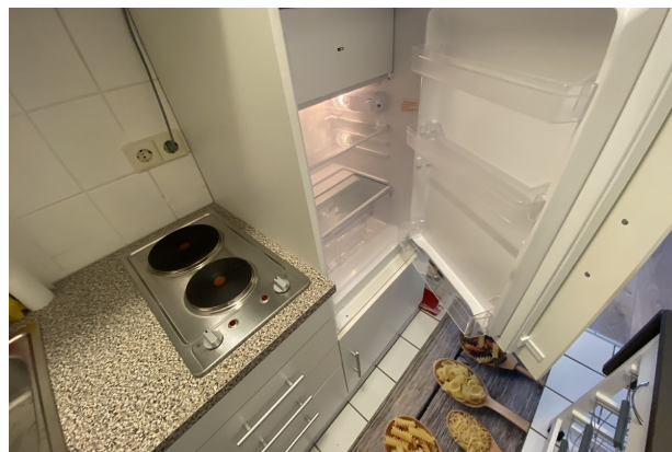
Kühlschrank, neu und unbenutzt