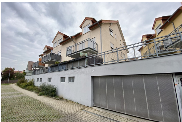
Rückansicht mit Garagentor