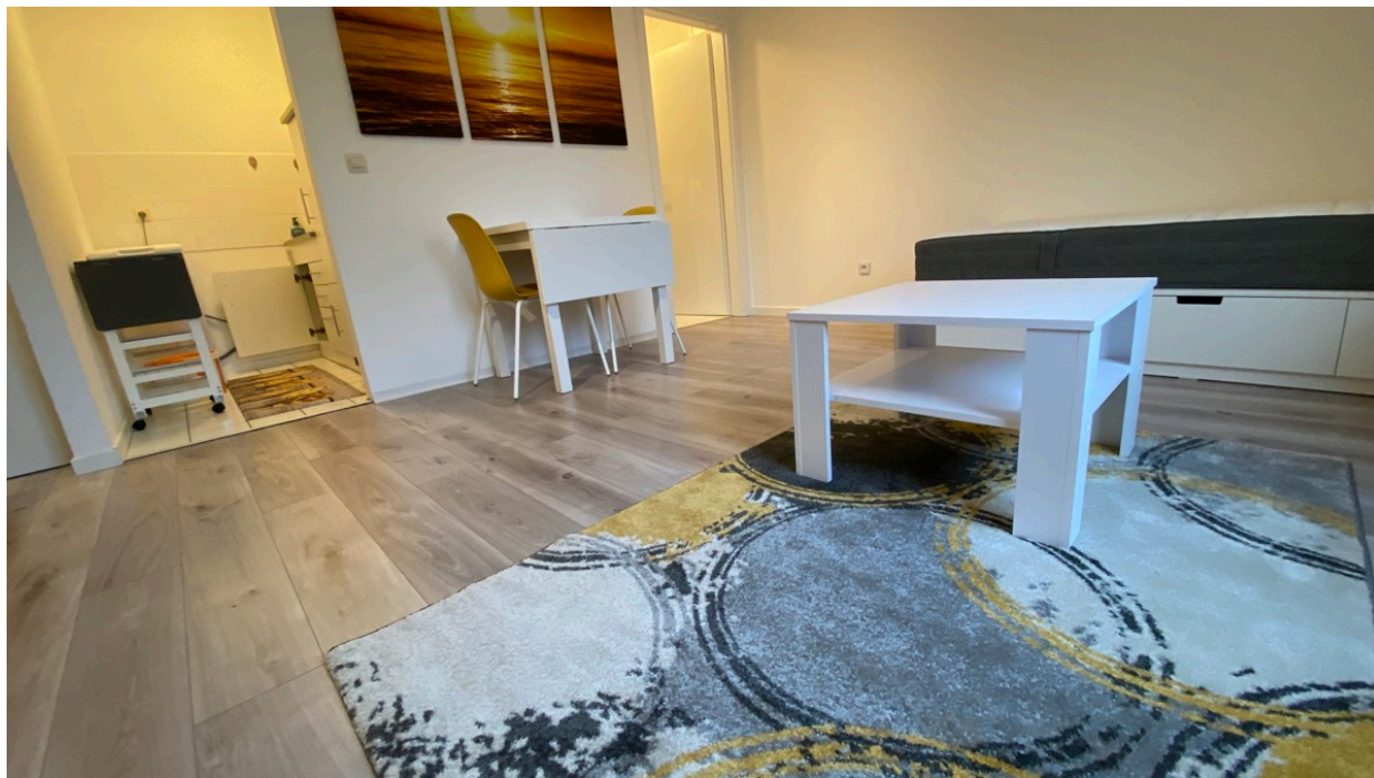
Wohnzimmer möbliert, aktueller Zustand