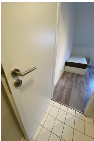
Türen neu 2020