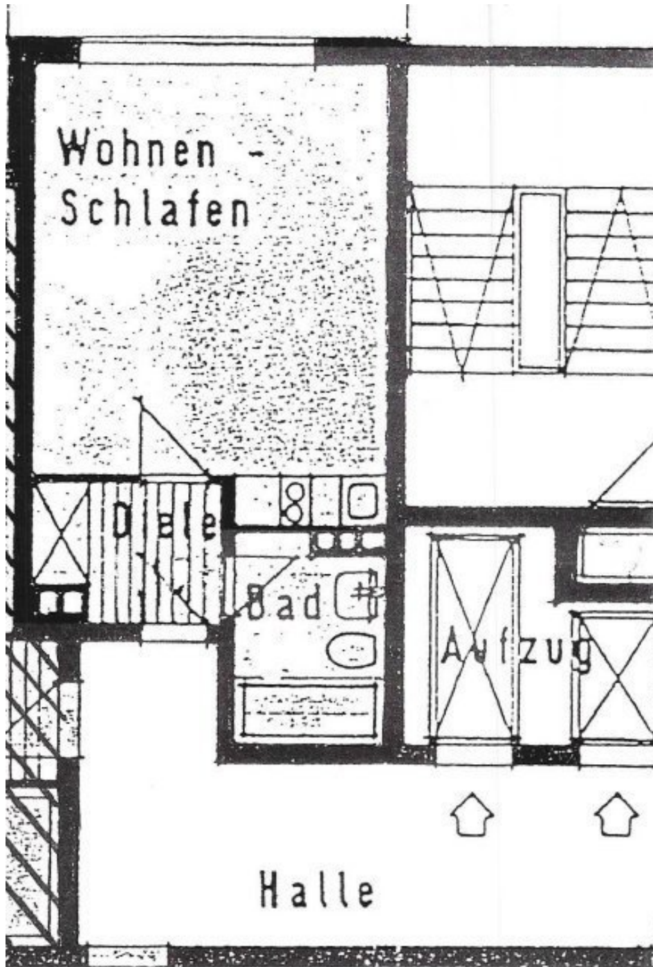
Grundriss 1-Zimmer Wohnung im 15.OG