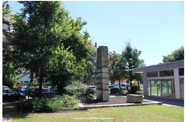
Grüne Umgebung und trotzdem zentral