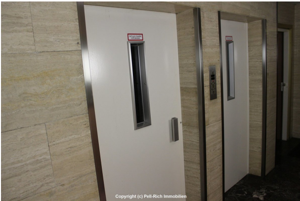
2 Aufzüge vorhanden